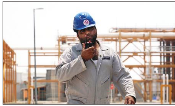
شاغلان مجتمع همچنین تکمیل فرآیند تعدیل مدرک تحصیلی بیش از ۳۰۰ نفر از همکاران از جمله اقدام‌های انجام‌شده است.